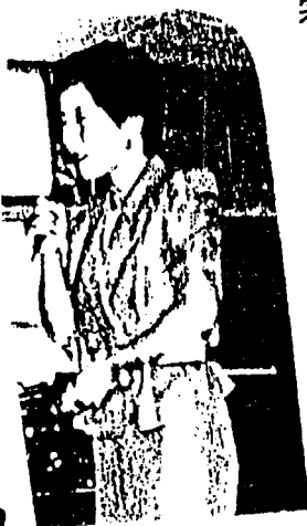
前回総会で「くまやん」をひろ

五月の連休から一か月ほとんど毎朝三時半に起きて、駅頭にたち、おおくのかたのけがましを頂きました。候補者としての活動を支えてくれた家族に心から感謝しています。特に七十四才の養母は、家の中のことをすべてこなしてくれました。夫も家族の中心となって家庭のすみずみに目をくばってもらいました。結婚して今年で二十年になりました。家庭のなかでの、話し合い、信頼の大切さを改めて感じています。