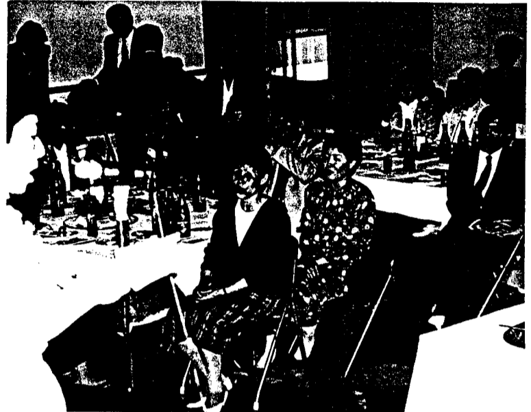
歌声もあり盛りあがった祝賀会