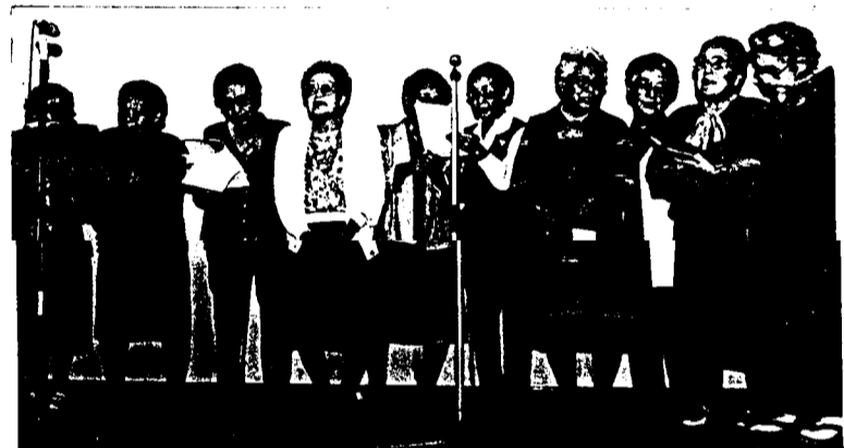
程久保“しあわせコーラス”のみなさん