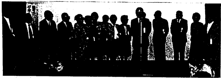
診療所創立に尽力された功労者のみなさん