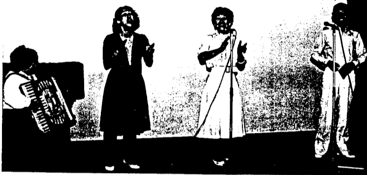
うたごえ集団ともしびのみなさん