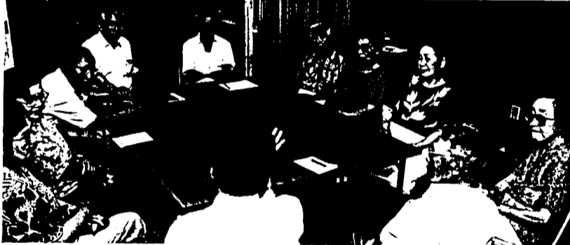
医療問題について話し合ういずみ・しらゆり班(6月2日)

新都市舎し、余りの偉容さに驚き、知事室が三シロク五十八戸分という新聞記事を思い出し、「夕摩平の都営住宅にさえ高家賃のため、もどれない人がいる」と怒りがこみあげました。