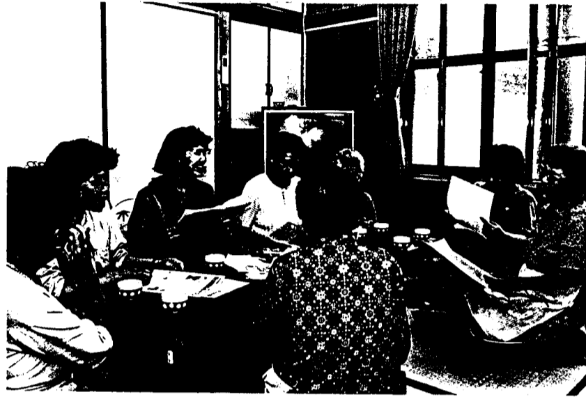
体操のあとにぎやかに話し合うコスモス班(6月15日)