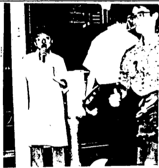
訴える 渋谷事務長