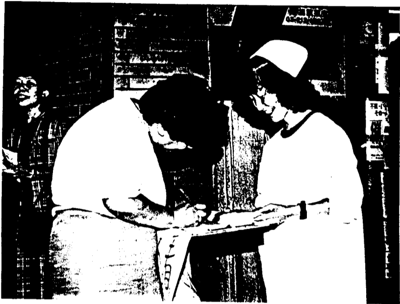
心がよい合い笑顔で署名 (9月18日)