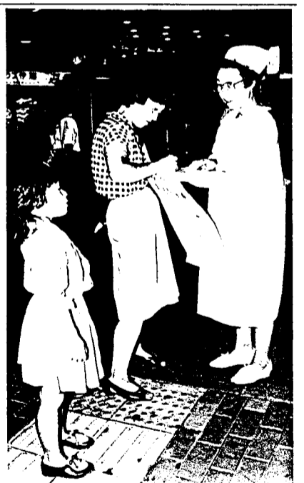
子どもづれのお母さんも署名