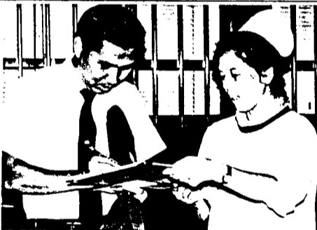
サラリーマンの方も快く署名