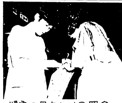
帰宅の足もとめて署名