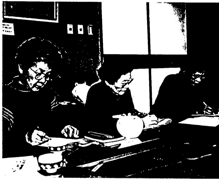
真剣にメモとりながらの学習会(2月22日)