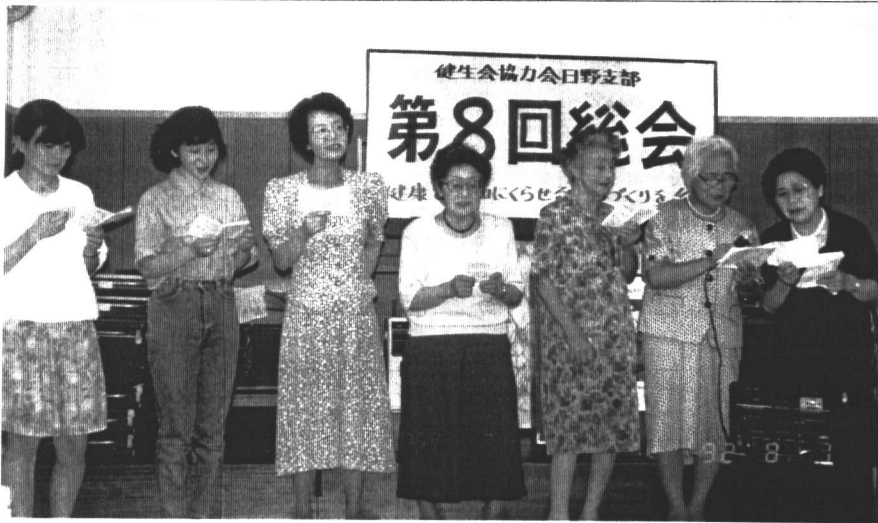
←「夏の思い出」の合唱

去る8月1日(土)午後2時から、健生会協力会日野支部の第八回総会が日野台四丁目地区センターで開かれました。 一年間の活動報告とこれから一年間の方針を確認し、総会終了後は懇親会で親睦を深めました。