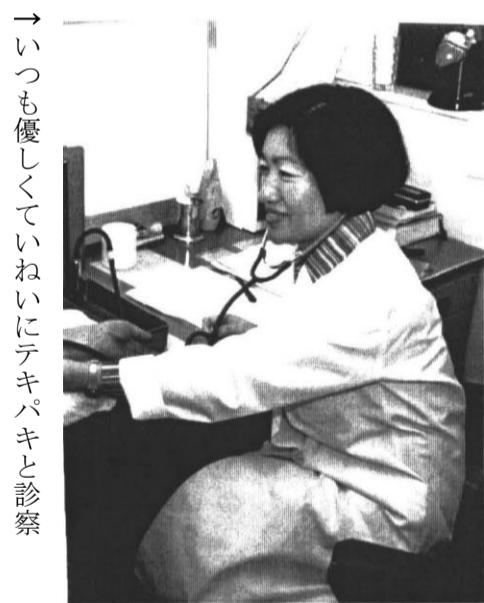
→いつも優しくていねいにテキパキと診察