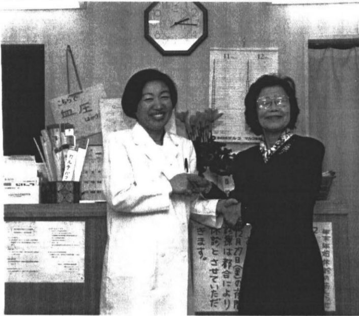
↓より良い医療のために職員と真剣に論議